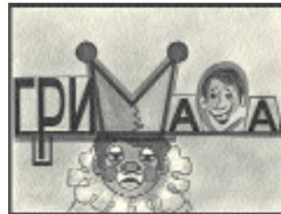
Рисунок-загадку дети расшифровывают самостоятельно. Он включает в себя сразу два слова.

Пояснение: печальный клоун – актёр с гримом на лице – изображён в шутовском головном уборе, напоминающим букву М (значит, она одна). Поодаль от него изображено лицо кривляки, которое помещено в букву С (она тоже одна) и строит гримасу .